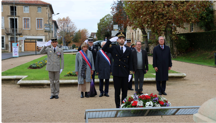
Présentation de Clément Frézet, sous-préfet de Mirande

Clément Frézet, 29 ans, juriste de formation, j'ai fait mes études à l'université de Bordeaux qui est ma ville d'origine, à la faculté de droit durant cinq années.