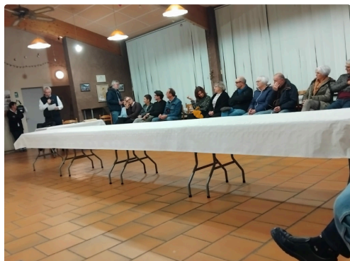
WhatsApp Image 2025-11-15 à 16.50.03_d6f574fd.jpg

Un apéritif dinatoire clôture cette rencontre avec un air, une humeur, de reconnaissance et de partage