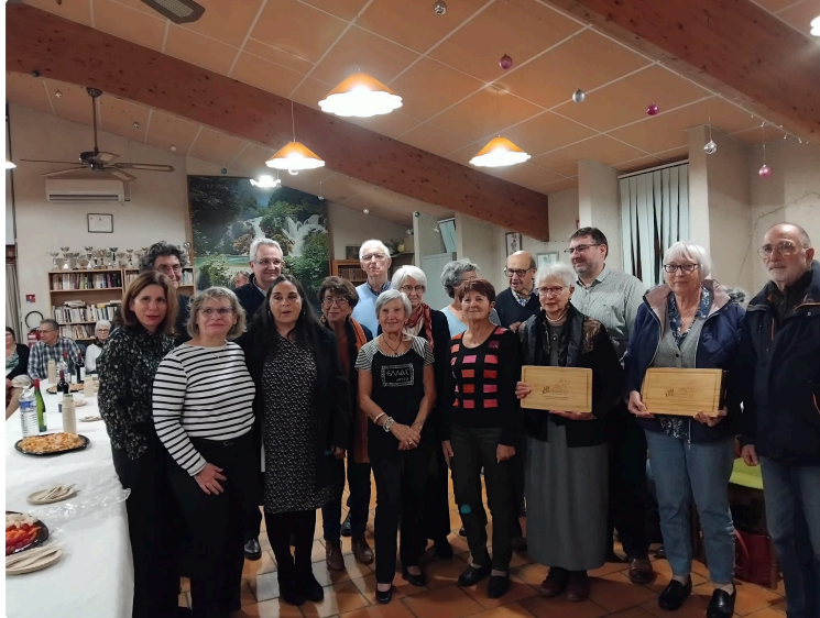
Office du tourisme : un immense merci à tous les bénévoles