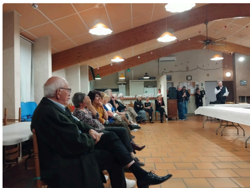
WhatsApp Image 2025-11-15 à 17.22.53_7bbb06ad.jpg