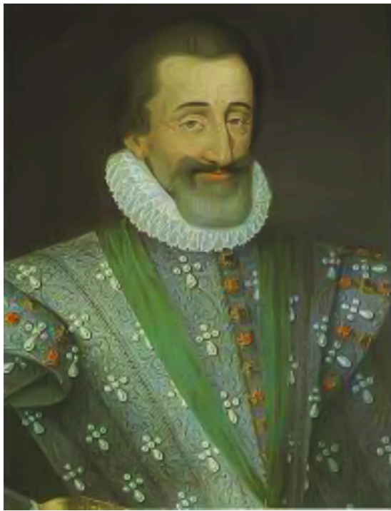
Henri IV (sur le vite de Vikidia)