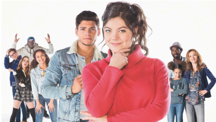
Cine blabla : "Jugement et harcèlement : comment en parler à nos ados ?"

Judi dernier avait lieu la journée nationale contre le harcèlement scolaire. Cette journée a donné lieu à une animation au collège Gabriel Séailles.