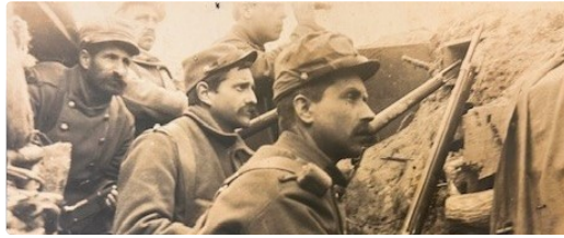
Conférence Récits intimes de trois marraines de guerre pendant la première guerre mondiale