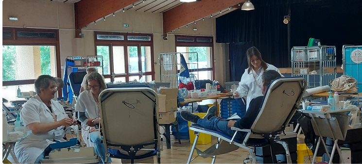
Don du sang du 27 et 28 novembre : les associations vicoises partenaires !

L'amicale vicoise pour le don de sang bénévole vous attend