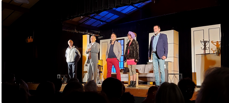
Salle comble et rires en cascade pour "Le Dîner de cons" des Arthurs

La salle polyvalente était comble vendredi soir pour la deuxième soirée-théâtre organisée par l'association In & Off.