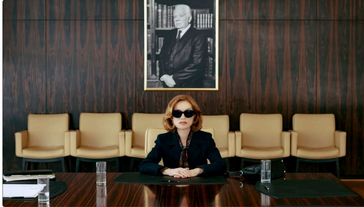
Cinequanon : animation, thriller, comédie et drame au programme

A noter cette semaine, le dernier film avec Isabelle Huppert et Laurent Lafitte et le dernier François Ozon avec Benjamin Voisin.