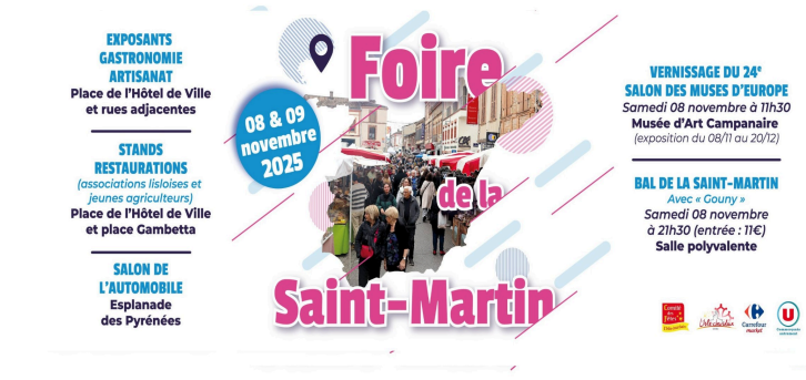
48 e Foire de la Saint-Martin : une tradition vivante et conviviale