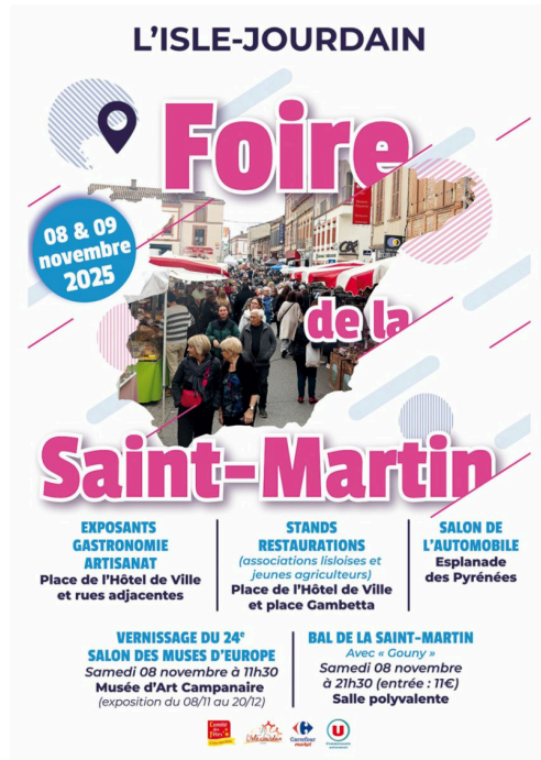
Affiche Foire St-Martin.jpg