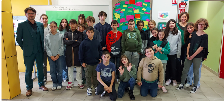
Collège Gabriel Séailles : une mobilisation collective contre le harcèlement scolaire

Judi 6 novembre 2025, le collège Gabriel Séailles s'est pleinement engagé dans la journée nationale de lutte contre le harcèlement scolaire, un rendez-vous annuel institué depuis 2015 pour sensibiliser les élèves, enseignants et personnels éducatifs à ce fléau.