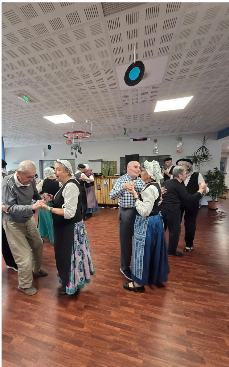
EHPAD de l'hôpital : rejoignez l'équipe des bénévoles !

À l'EHPAD de l'hôpital de Vic-Fezensac, l'animation occupe une place essentielle dans la vie quotidienne des résidents. Elle contribue à préserver leur bien-être, leur autonomie et surtout, le lien social si précieux au sein de la structure.