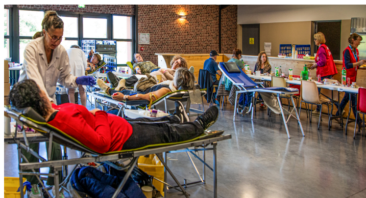
Une activité intense