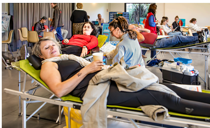
Toujours plus de donneurs !