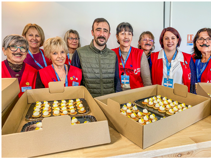
Les pâtisseries d'Alain Tarbe et des bénévoles