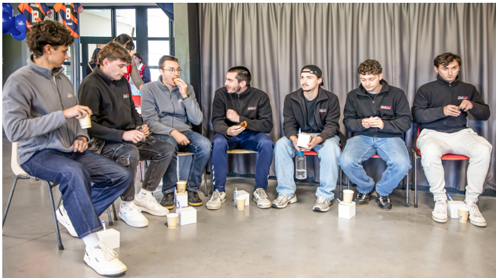
Ces étudiants de l'École de la performance attendent leur tour

Cela prouve, une fois de plus, que, souvent, quand on fait appel à la solidarité, ça paye !