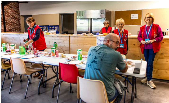
La collation est prête

Sans oublier que la Communauté Professionnelle Territoriale de Santé (CPTS) a fourni des prospectus anti-tabac.