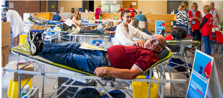
Nogaro : collecte de sang record le 3 novembre 2025

109 donneurs le 3 novembre 2025, dont dix qui venaient pour la première fois. L'association DSNA (Don du sang Nogaro Aignan) n'avait pas encore atteint ce nombre. Prévues à 18 h 30, la clôture de la collecte n'a pu avoir lieu qu'à 19 h 15 !