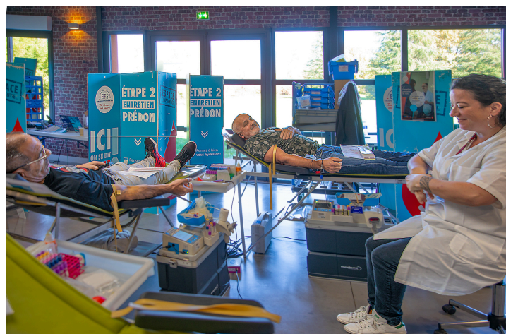
Un autre coin de la salle de collecte