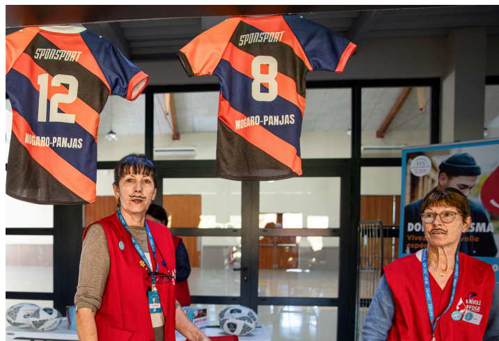
Maillots et moustaches