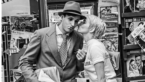
Cinequanon : la programmation de la rentrée !

C'est la rentrée ! Votre cinéma vous attend pour vos soirées d'automne !