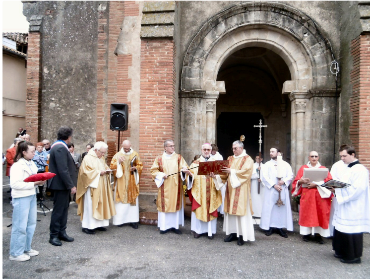
Après plus de deux ans et demi de travaux, l'église St Pierre " dédiée " c'est-à dire restituée au culte

En ce jour de Toussaint, tout un symbole !