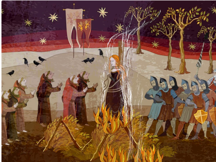
LA SORCELLERIE : une longue histoire