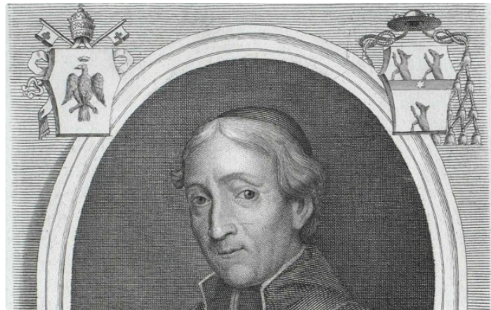
Société archéologique du Gers, prochaine réunion mercredi 5 novembre 2025

La prochaine réunion de la Société archéologique du Gers aura lieu le Mercredi 5 novembre 2025 à 14h 30 au 13 place Salluste du Bartas à Auch.