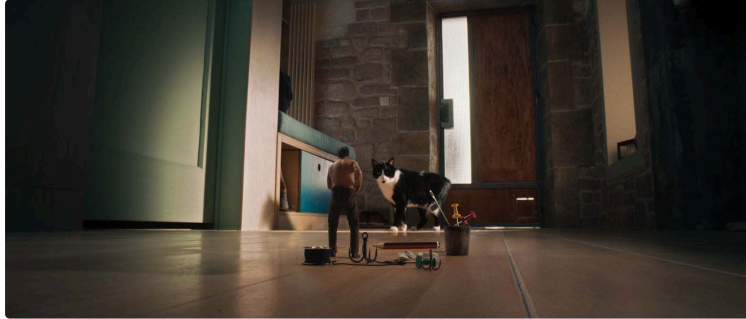
Cinequanon : animation, thriller, comédies et aventure au programme de la 2e semaine de vacances

Deuxième semaine de vacances avec une programmation pour tous les âges !