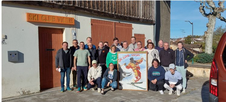
Le Ski Club Vicois ouvre ses portes !

La journée portes ouvertes du ski club vicois aura lieu