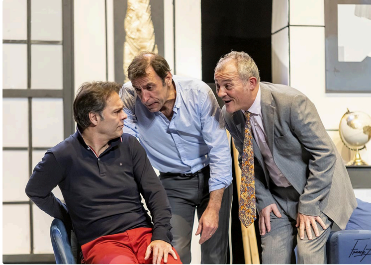
In § Off propose la pièce culte "Le dîner de cons" !

Deuxième soirée-théâtre proposée par l'association In § Off