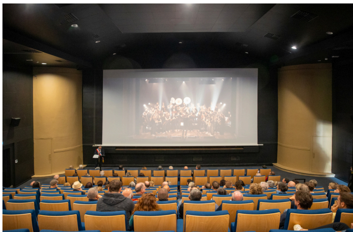
La salle vue de l'arrière

Xavier Lacoste décrit les problèmes auxquels son cabinet et les entreprises ont été confrontés, problèmes qu'il a fallu résoudre dans un délai restreint.