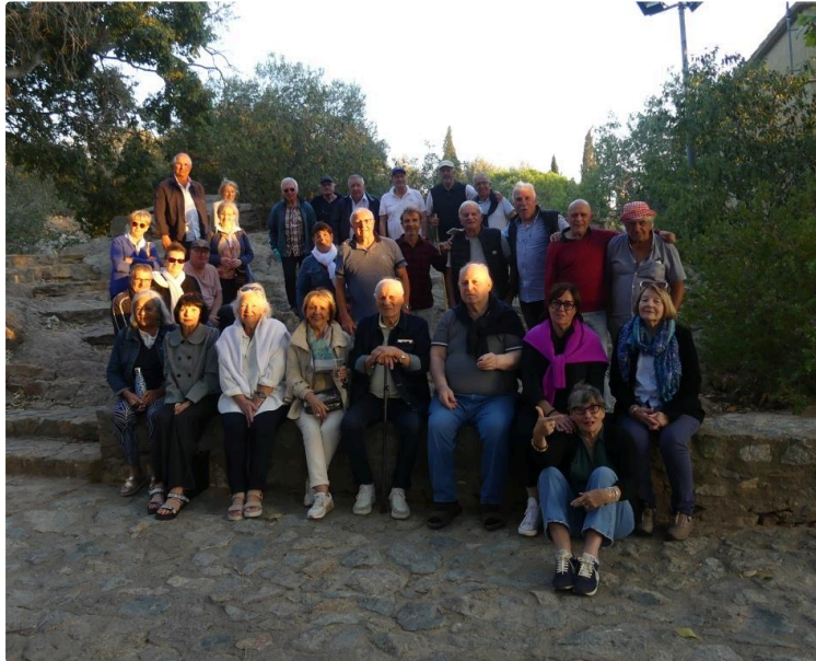
Un grand weekend en Espagne pour les 10 ans des amis de l'UAV

Plaisirs partagés, bonne humeur et visites culturelles