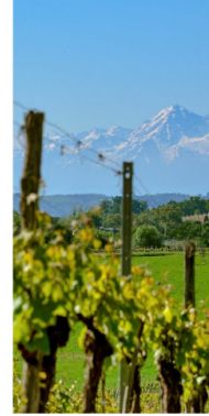
Assemblée générale Galerie Bleue-Plaimont