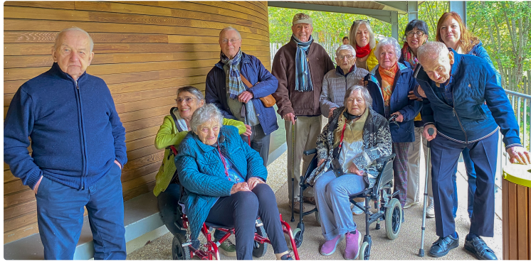
Un automne animé pour les résidents de la résidence Saint Jacques La Roméviennne