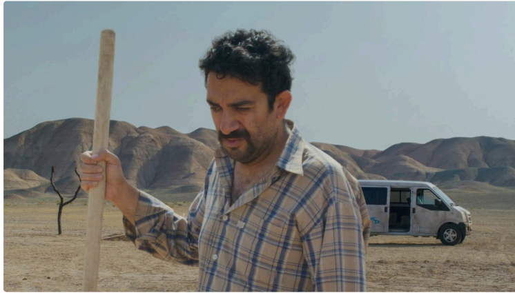
La palme d'Or à Cannes 2025 au cinéma cette semaine

Cine Qua Non diffuse cette semaine le film qui a obtenu la palme d'Or au festival de Cannes 2025.