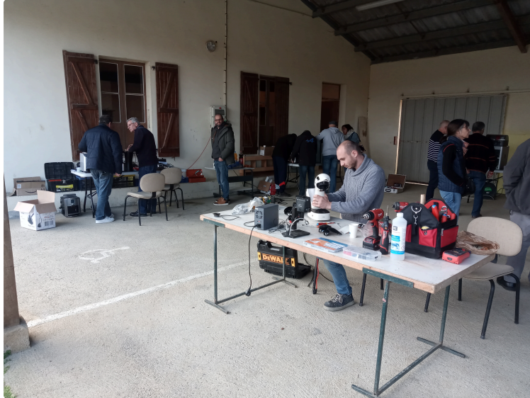
Prochaine séance du Repair Café et du Fab lab à Callian samedi !

La prochaine séance du Repair Café et Fab lab aura lieu