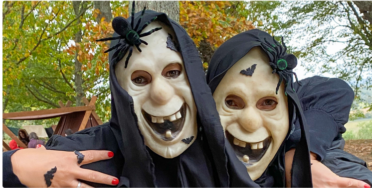
Halloween à la Tour de Termes