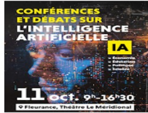
L'Intelligence Artificielle au cœur de conférences

Le samedi 11 octobre, dès 9h, la Ville de Fleurance organise une journée de conférences et de débats autour de l'Intelligence Artificielle.