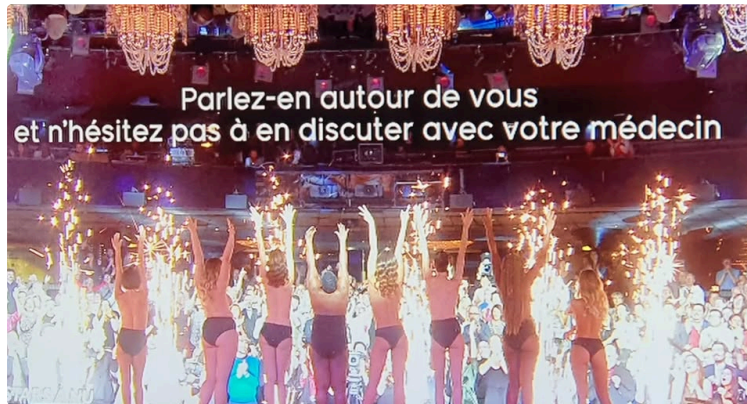
Octobre Rose à La Romieu

Octobre Rose est un mois de sensibilisation et aussi une invitation à agir. Chacun peut participer à sa façon, marcher, jouer, donner, ou simplement relayer l'information. Pour la sixième année, nous vous proposons un weekend convivial et engagé, au profit de la lutte contre le cancer. L'intégralité des bénéfices de ce weekend sera reversée pour recherche, via l'Institut Bergonié de Bordeaux et le centre Claudius Régaud de Toulouse.