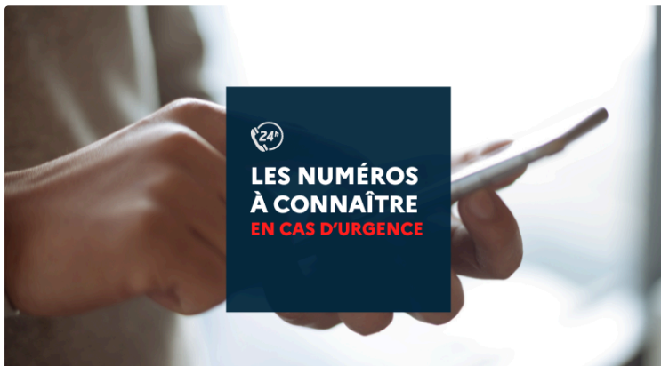
Des numéros à connaître pour bien réagir en cas d'urgence

La CPTS (Communauté Professionnelle Territoriale de Santé) Gascogne Armagnac communique :