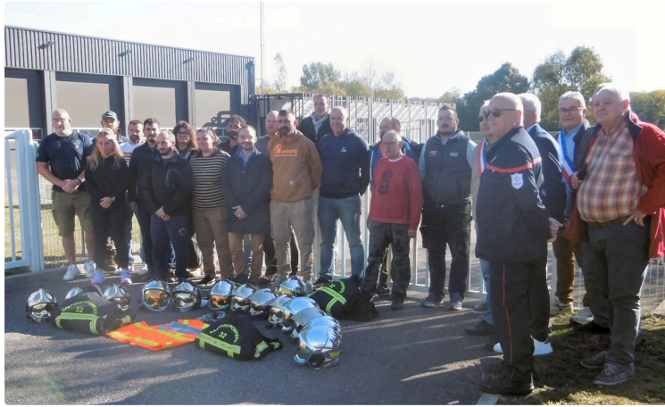
Les pompiers dans la grogne

trop de revendications restées sans réponse