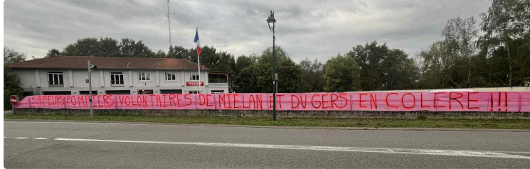
Les sapeurs-pompiers de Miélan voient rouge

Des projets gouvernementaux visent à remettre en cause des acquis des sapeurs-pompiers volontaires qui représentent 95% des effectifs gersois.