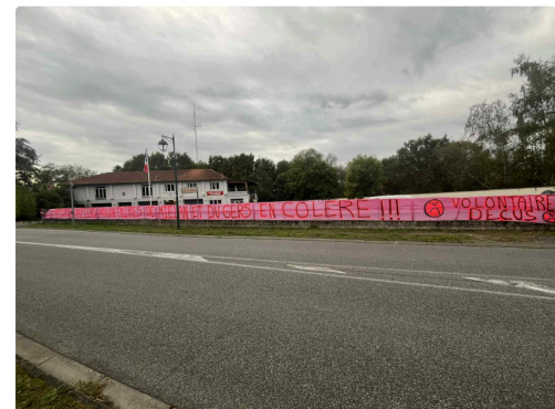
Pompiers Miélan 23092025 2.jpeg