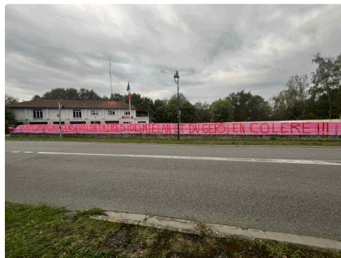
Pompiers Miélan 23092025 1.jpeg