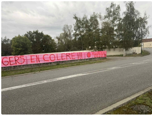
Pompiers Miellan 23092025 3.jpeg