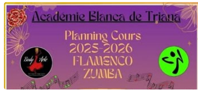
Planning danse – Saison 2025-2026