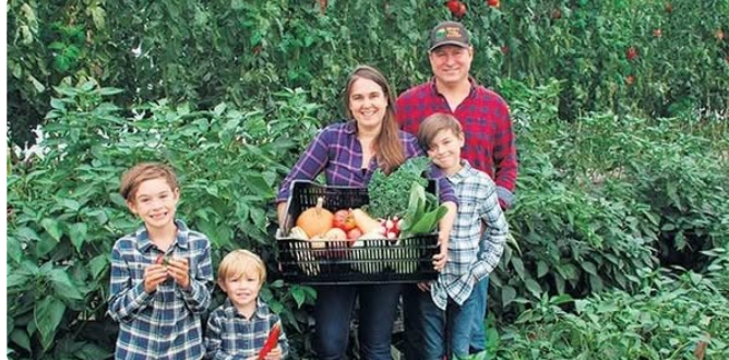
L'homme dans la nature