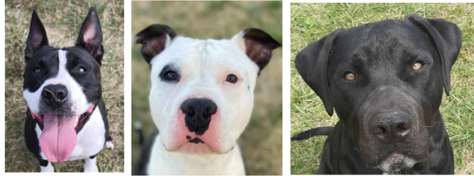
Sanka, Loky et Aïko, les trois jeunes chiens de la semaine

Cette semaine, la SPA vous présente trois nouveaux arrivés, Sanka, Loky et Aïko.