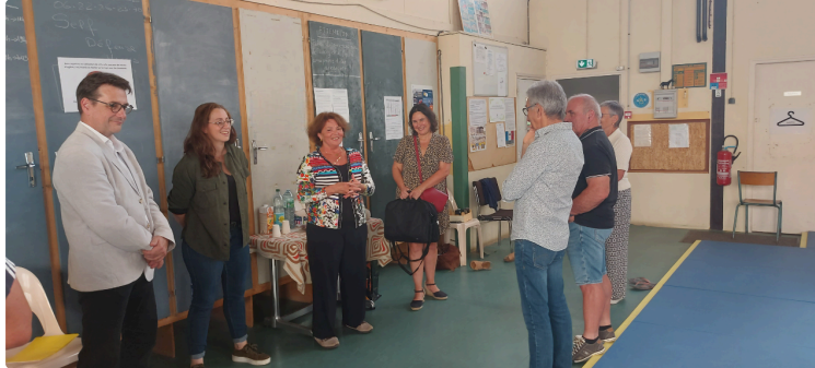
Le Département donne un coup de pouce numérique à la Gym Volontaire Vicoise

Mercredi 17 septembre, le club de gymnastique volontaire de Vic-Fezensac a vécu un joli moment de convivialité au COSEC.