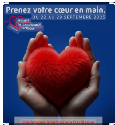
Première édition de la Semaine de l'Insuffisance Cardiaque en Occitanie

SEMAINE DE L'INSUFFISANCE CARDIAQUE EN OCCITANIE : du 22 au 29 septembre , en lien avec la Journée mondiale du coeur