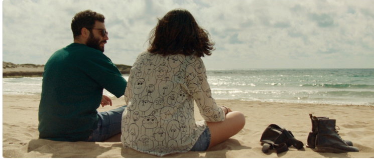
Au cinéma cette semaine "Chronique d'Haïfa", le grand film de la rentrée