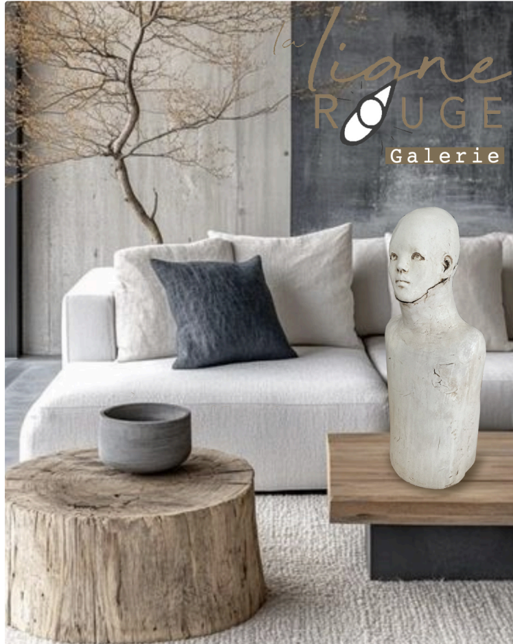
L'Atelier la ligne ROUGE participe aux 1ères Journées Nationales des Artistes

Des milliers d'artistes à travers la France et des centaines de structures et collectivités locales ouvriront gratuitement leurs portes offrant une occasion unique de découvrir les œuvres et d'échanger directement avec les artistes les 13 et 14 septembre 2025.