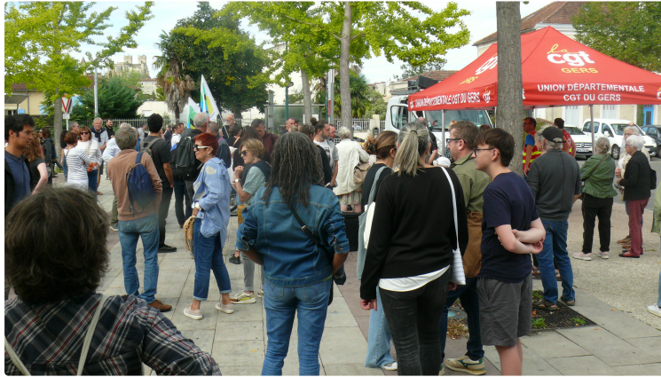
"Bloquons tout", les hypermarchés pris pour cible

Un incendie criminel bloque la ligne Toulouse -Auch