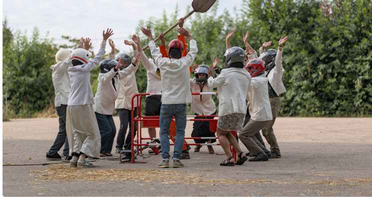
La rentrée culturelle de La Petite Pierre : c'est maintenant !