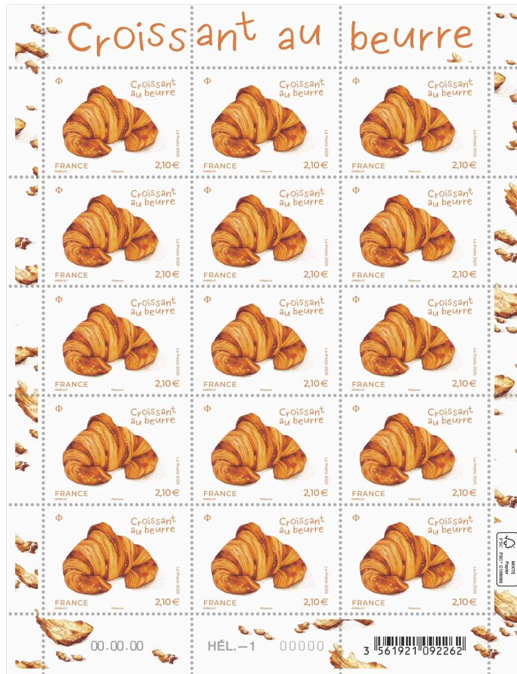
Le nouveau timbre aura une délicieuse senteur de croissant !

Le 8 octobre 2025, La Poste émet un timbre et un souvenir philatélique odorants, illustrés par un délicieux croissant au beurre, un classique de la boulangerie artisanale française.