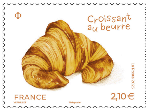
1125034-RF TP Croissant Au Beurre_Pub.jpg