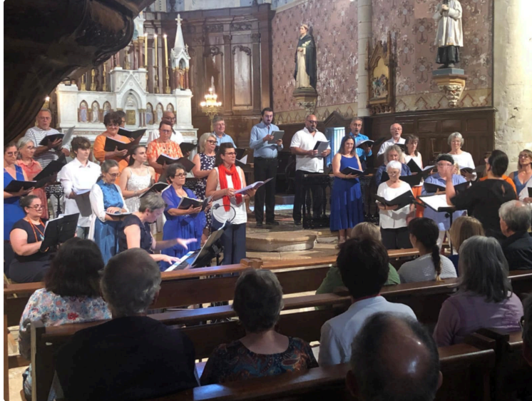
Triomphe retentissant dans l'église