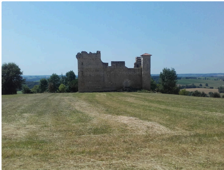
Journées du Patrimoine à Lagardère : quand un château en ruine fait battre le cœur du Gers !

Le petit village de Lagardère (Ténarèze, Gers) s'apprête à faire vivre son château du XIII e siècle autrement que par les pierres et les souvenirs.