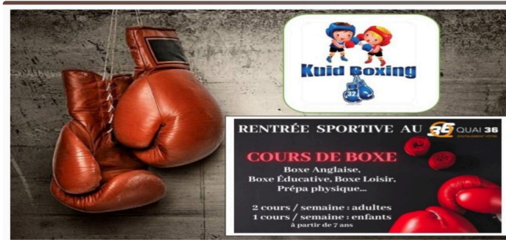
La Boxe loisir pour Enfants, Ados et Adultes, mixtes.