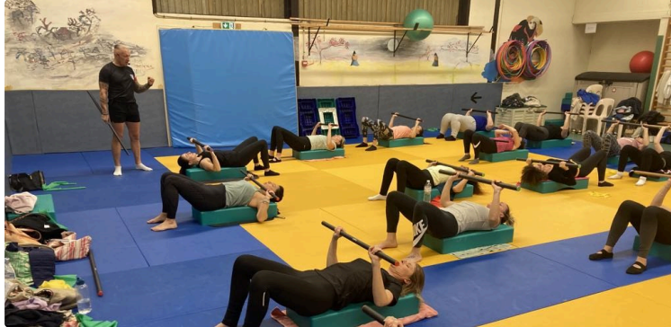
La Gymnastique Volontaire Vicoise est prête à vous accueillir !

Lundi 8 septembre, ce sera la rentrée sportive pour le club de Gymnastique Volontaire Vicoise qui vous propose trois types d'activités :