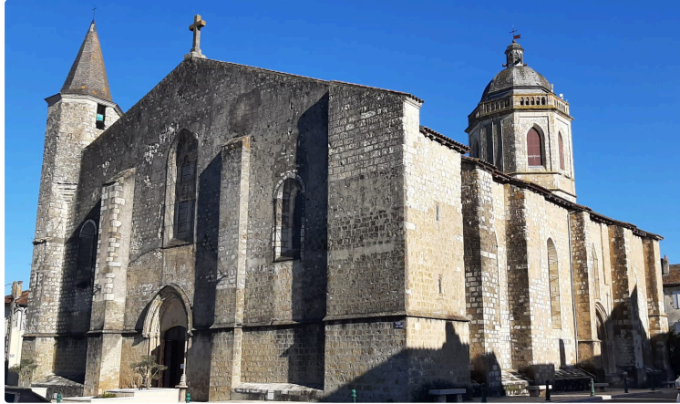
Concert orgues et trompette en l'église Saint Pierre

Les Amis des Orgues de l'église Saint-Pierre de Vic-Fezensac organisent un concert orgues et trompette