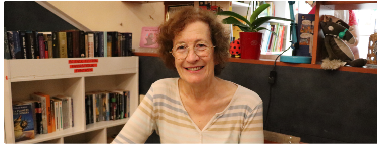
Astarac, l'âme paysanne