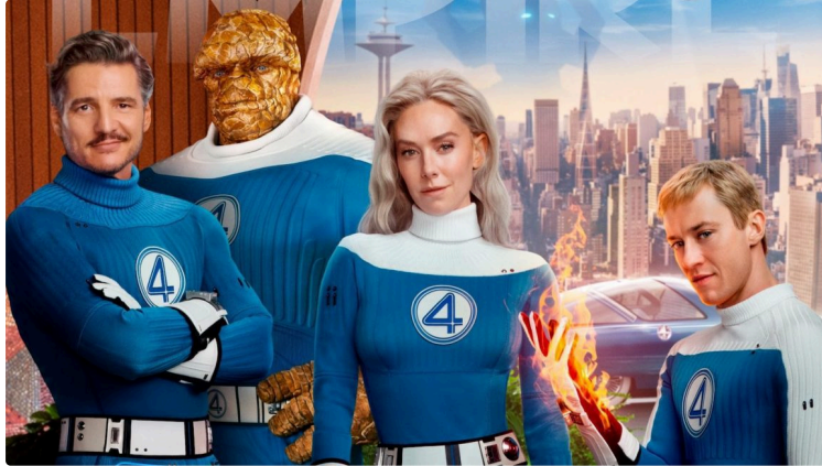
Cinequanon : la première famille Marvel à l'honneur cette semaine

Le cinéma reprend cette semaine et ce sont encore les vacances !