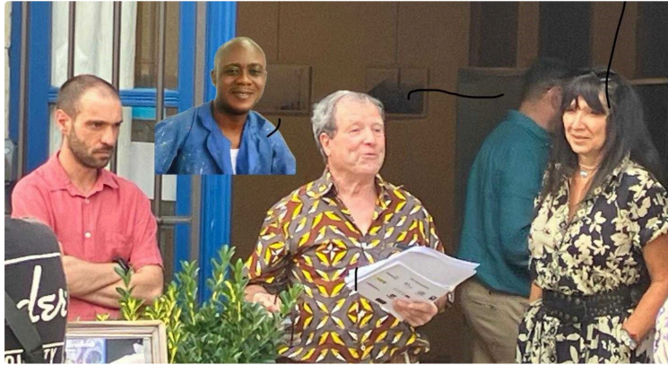
Une exposition hors du commun : 3 artistes aux univers si différents

Il est impossible de manquer cette nouvelle exposition à l'Espace Culturel à Valence-sur-Baïse. Ce n'est pas la soixantaine de personnes présentes au vernissage vendredi dernier qui diront le contraire. D'un avis unanime, si rare pour être souligné, il est donné à voir des oeuvres exceptionnelles.