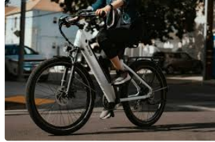
Communiqué de l'agglomération Grand Auch Coeur de Gascogne

Test : L'agglomération lance un libre-service de vélos électriques